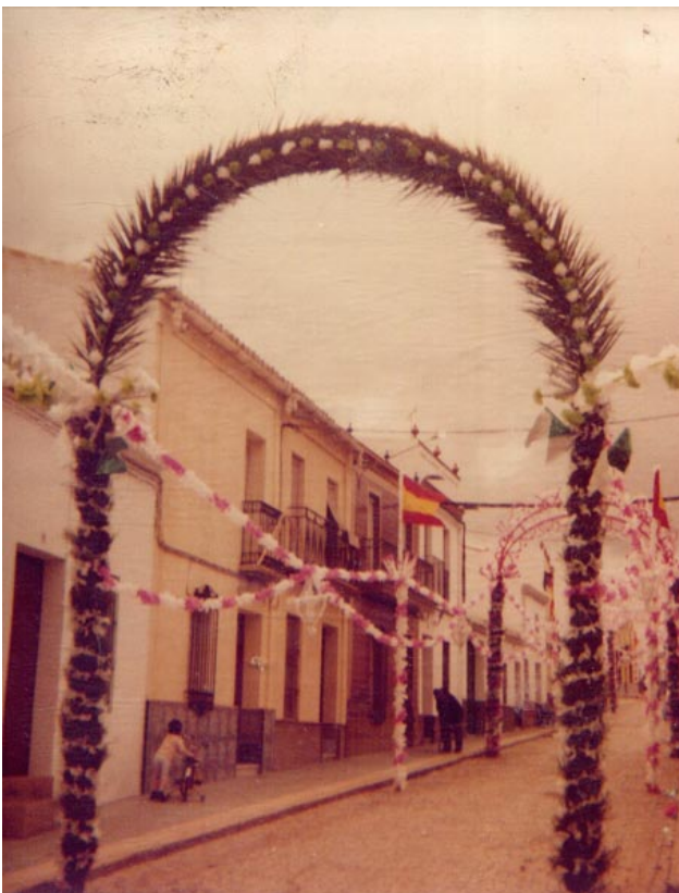
□ Foto 5: Instantánea del «Toldito» o «Paseito» de la calle Arriba. La fotografía data de los años cincuenta y en ella vemos el transcurrir de la «porcá» en medio del cante y del baile. Estos arcos eran de marquetería y su exorno muy laborioso. El primero, a modo de capilla, lo cerraba un lienzo en el que aparecía pintado un motivo eucarístico. Fueron cambiados en 1970.