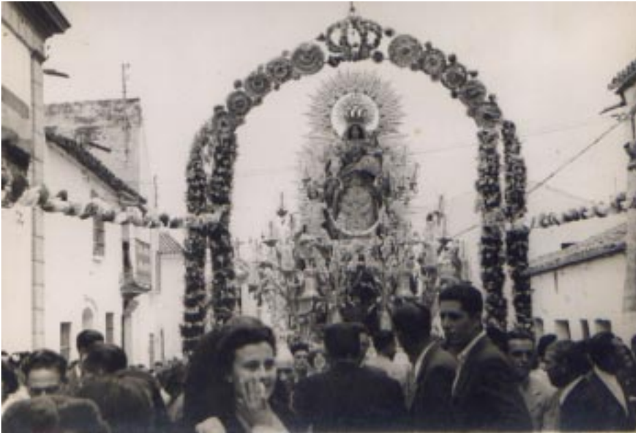
□ Foto 3: La Virgen bajo un desaparecido arco, de originales y curiosos elementos decorativos, situado en uno de los extremos de la calle Monge y Bernal. Principio de los años 40.