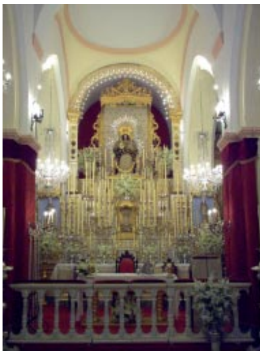
Del 4 al 12 de Septiembre. Novena a Ntra. Stma. Titular. La Patrona en su altar colocado en la Parroquia de San Martín.