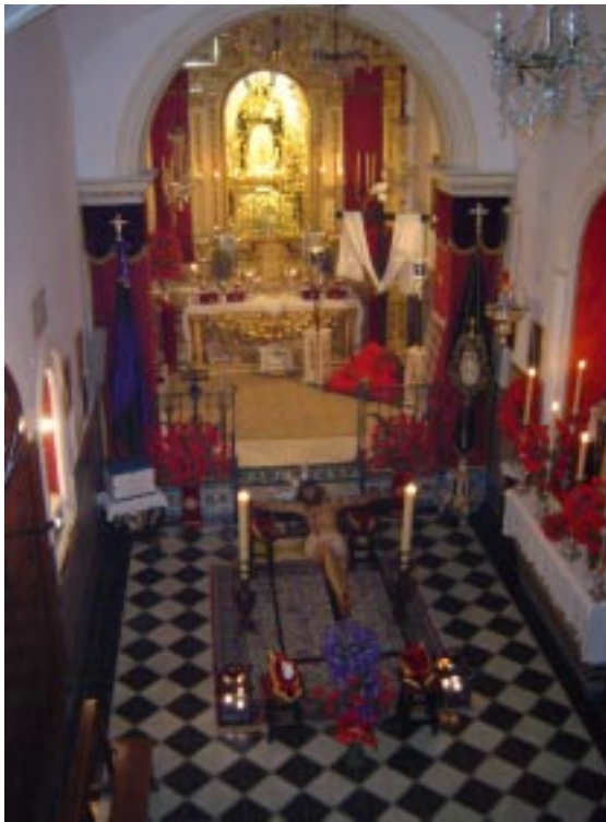
Del 23 al 26 de Marzo. Triduo al Santísimo Cristo de la Vera Cruz.