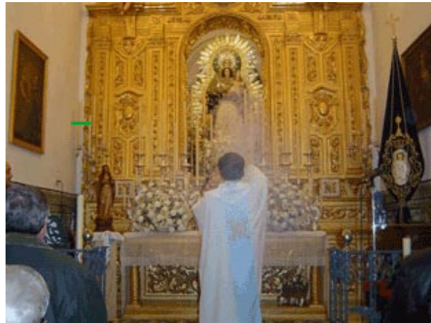
7 de Diciembre. Vigilia de la Inmaculada.