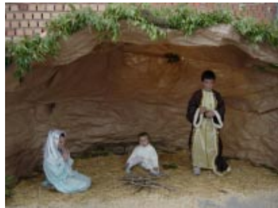
Actividades de Navidad. Entre ellas destaca este Belén viviente, organizado este año por vez primera.

Visita del Sr. Cardenal Fray Carlos Amigo Vallejo a nuestra Ermita □ Instantánea donde se encuentra orando ante el Santísimo Sacramento y Ntra. Amantísima Titular. □ Fotografiado junto a la Junta de Gobierno.