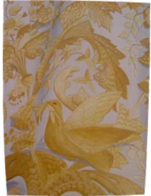
■ Foto: Pintura de D. Gabriel Cuadrado Cardellat. Reproduce un detalle del manto blanco de salida de Ntra. Sra. de Consolación, Patrona de Carrión.

Todos esperamos impacientes el nacimiento de Cristo. Su Madre Consuelo lo espera en su Ermita. Nace Jesús en nuestro pueblo y se quedará en este rinconcito de la gloria, rinconcito que todos los carrioneros consideran su más preciada joya. Durante todo el año estará en esta humilde capilla, oculto, pero presente a la vez en esa llama encendida que nos dice que Jesús está vivo. Arriba su Madre velando por Él, diciéndole que todos los carrioneros necesitan de su amor, de su misericordia