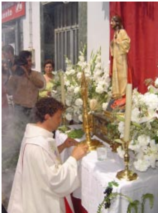
10 de Junio. Procesión Solemne del Corpus Christi. El Santísimo Sacramento descansa en uno de los altares que son colocados por los hermanos.