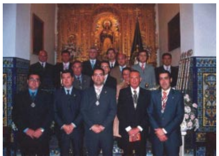
14 de Febrero de 2004. Se celebró Cabildo de Elecciones resultando elegidos los presentes miembros que componen la nueva Junta de Gobierno.